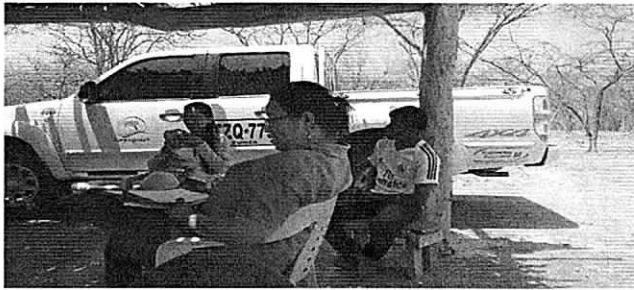
Fotografía 3 y 4. Socialización de la visita de seguimiento