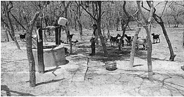
Fotografía 1. Parte exterior del aljibe