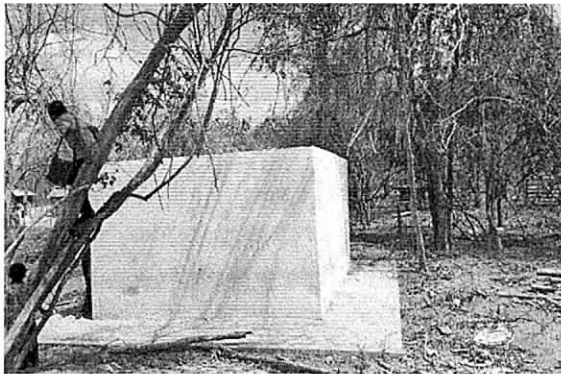
Fotografía 3. Alberca existente