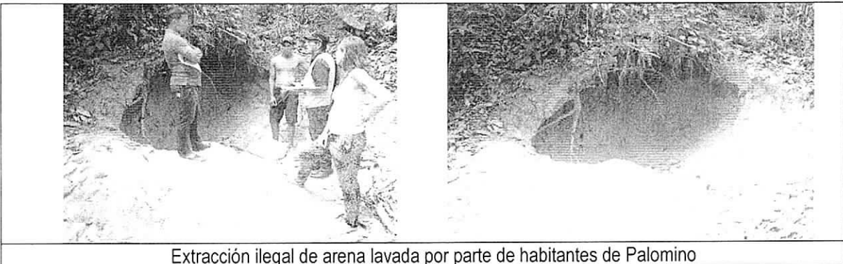
Extracción ilegal de arena lavada por parte de habitantes de Palomino