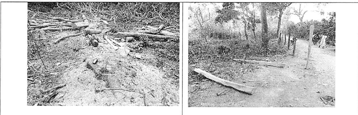
Evidencias de la tala del árbol de Morito y utilización de los productos obtenidos (Puntales)