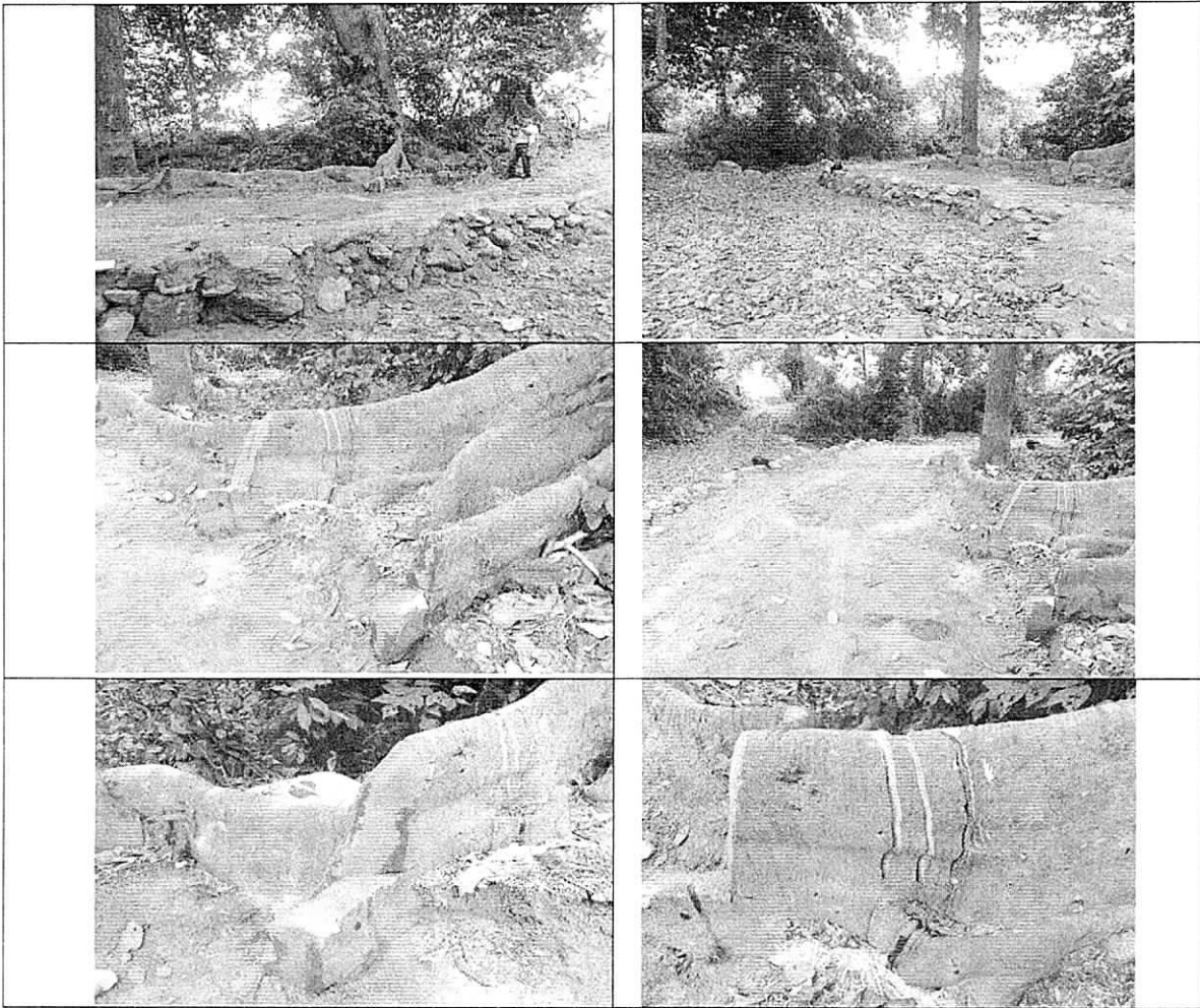
Las imágenes corroboran lo anteriormente expuesto (Corte de raíces y construcción de infraestructura dentro del cauce).