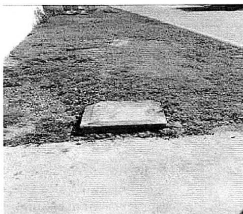
Fotografías No 6 - 8. Redes de alcantarillado, cajillas de inspección en la entrada de las viviendas y canales colectores de aguas lluvias a un costado de las vías.