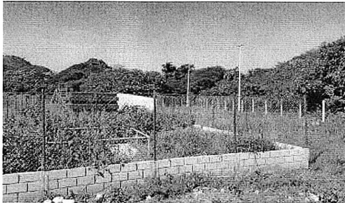
Fotografías No 1 - 2. Planta de tratamiento de aguas residuales ubicada en el corregimiento de Los Remedios.