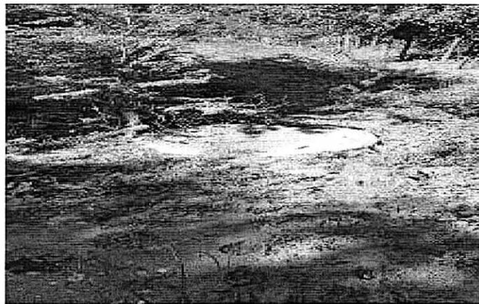
Fotografía No 3. Manholes conectados desde el corregimiento de Los Remedios hasta la Planta de tratamiento de aguas residuales ubicada en el mismo corregimiento.