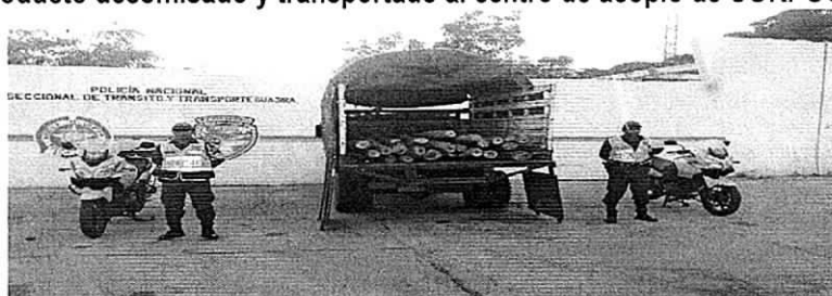
La foto muestra la cantidad de madera