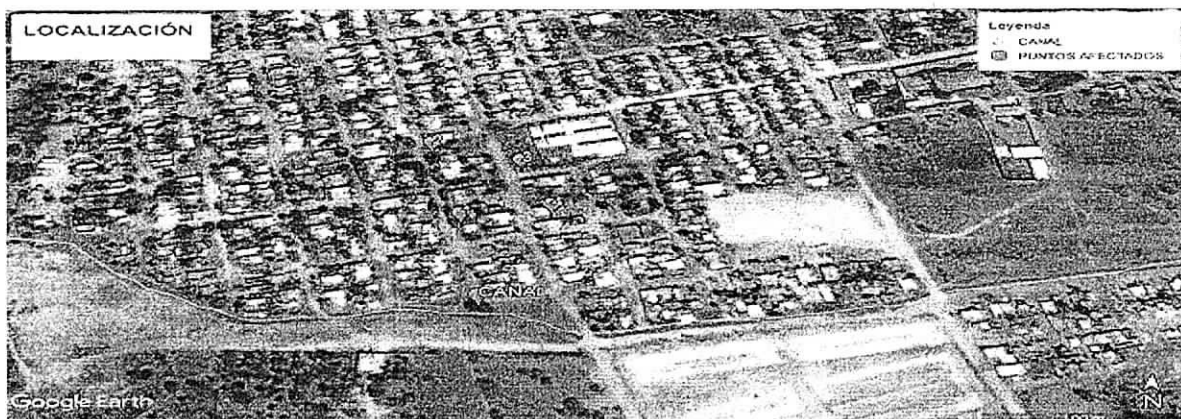
Figura 1. Localización de la zona afectada