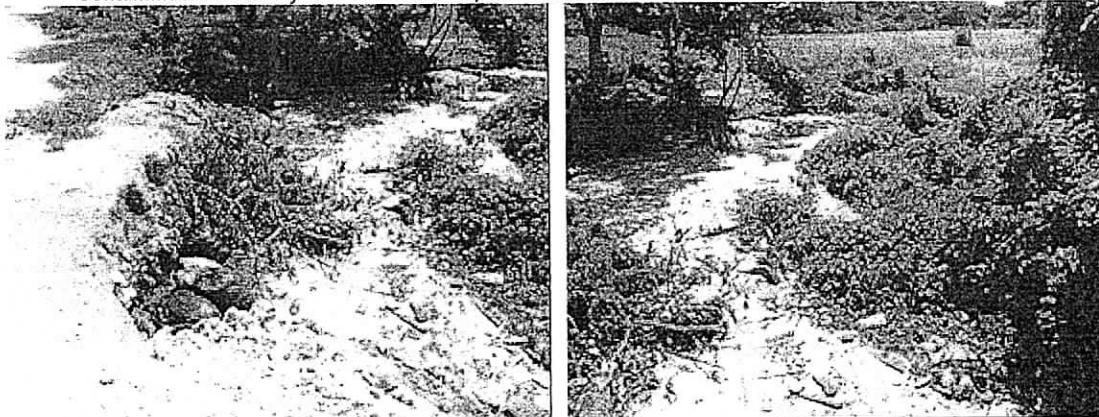
Contaminación a lado y lado de la tubería por donde entran las escorrentías superficiales al humedal.