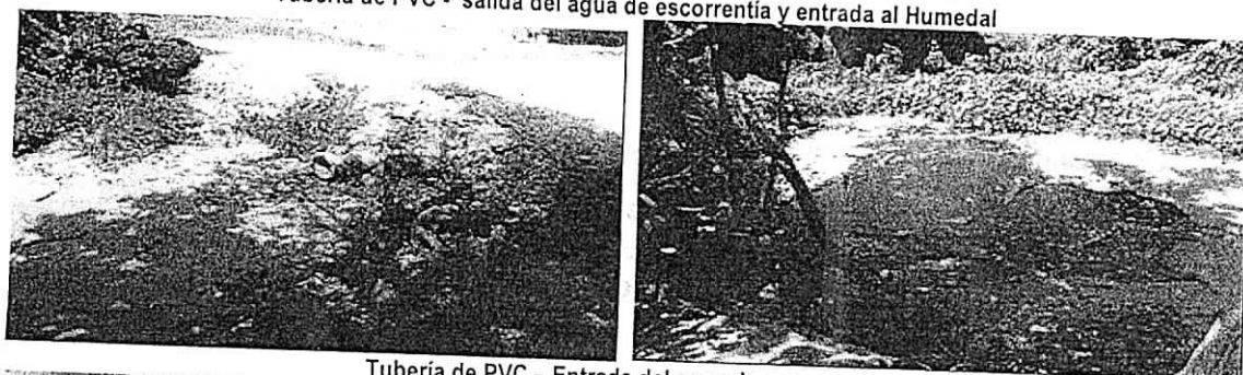
Tubería de PVC - Entrada del agua de escorrentía