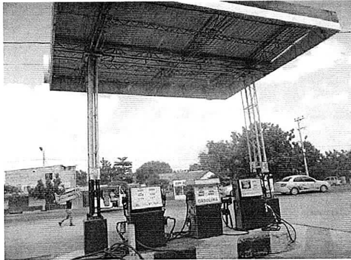
Foto No 1: Isla de despacho. EDS EL PROGRESO PEÑA. Maicao, 15 de diciembre de 2017.