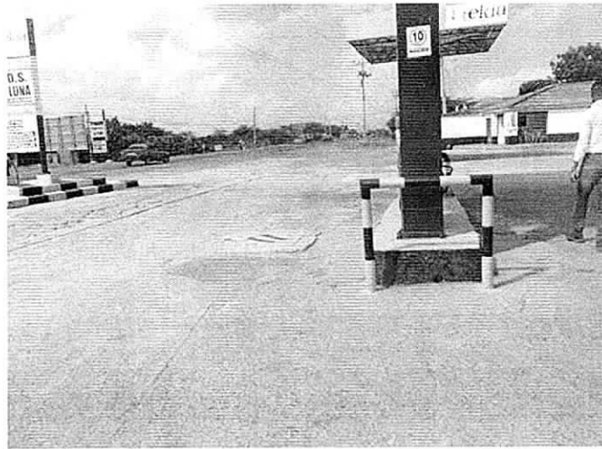
Foto No 3: Área de tanques de almacenamiento. EDS LA LUNA. Maicao, 15 de diciembre de 2017.