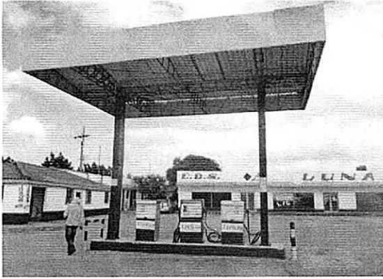
Fotos No 1 y 2: Islas de despacho. EDS LA LUNA. Maicao, 15 de diciembre de 2017.