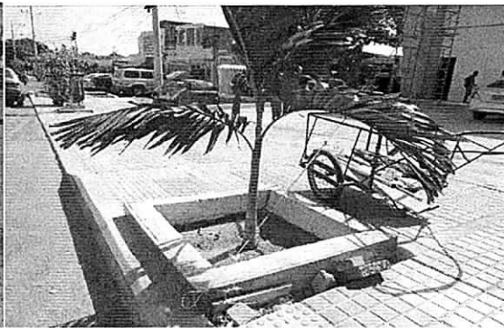
Evidencia de la siembra de una palmera