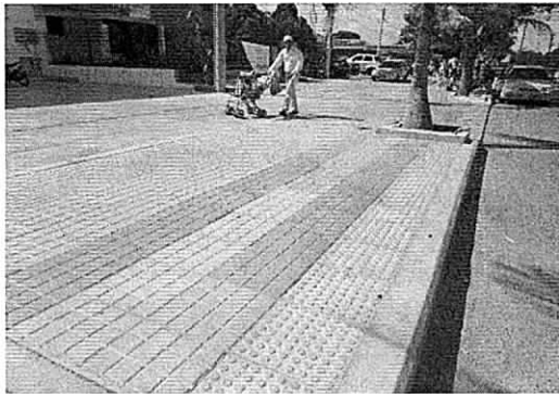
Espacio público adecuado