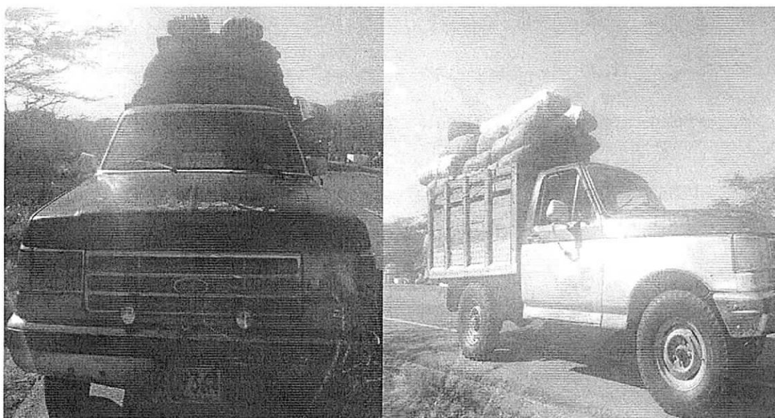
Se evidencia la placa del vehículo (RO9364)

NOTA. En el momento del decomiso la Autoridad Ambiental no contaba con acta única de control al tráfico ilegal de flora y fauna silvestre, dado que por inexistencia de las mismas, se había solicitado al MADS, nuevos consecutivos para proceder a cotizar impresión de los nuevos seriales adjudicados; por tal razón quedaron algunos decomisos sin entregarse formalmente en la Subdirección de Autoridad Ambiental y Secretaria General para los trámites pertinentes pero el funcionario de logística estaba enterado del decomiso para lo de su interés.