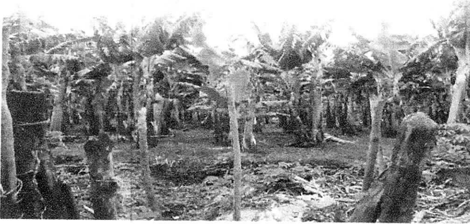
Fotografia 1 Zona trasera de la bananera Banaorganica