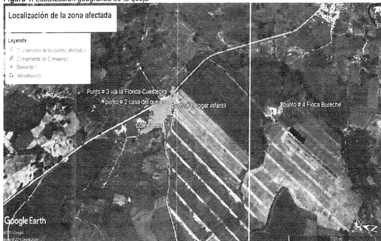
Figura 1. Localización geográfica de la queja