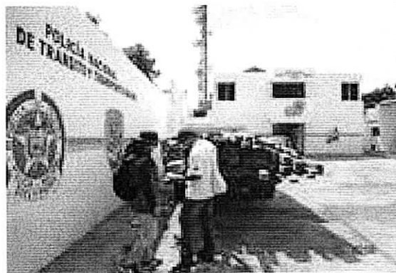
Las fotos corresponden a la madera incautada.