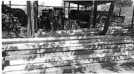
Las fotos corresponden a la madera ubicada en el predio río claro