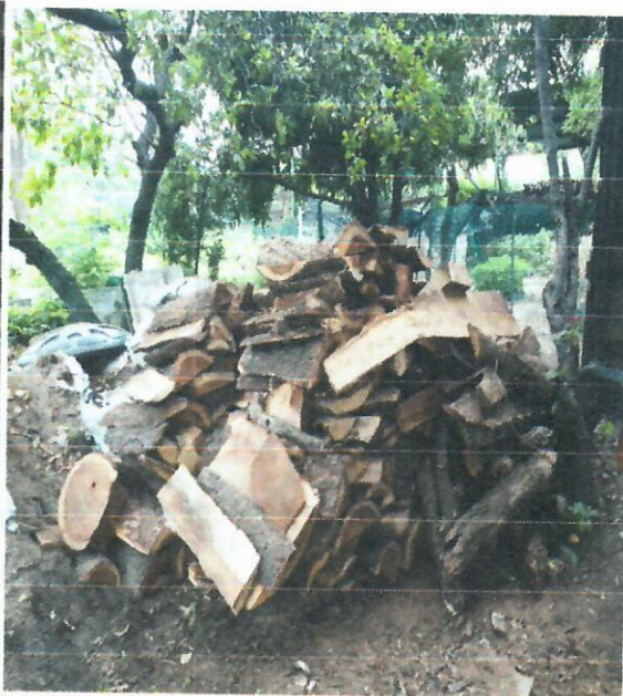
Fig. 3. Descargue de la materia prima Fig. 4. Total del Decomiso preventivo