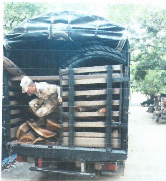
Fig. 1. Recepción de madera (orillos) Fig. 2. Puesto a disposición del decomiso