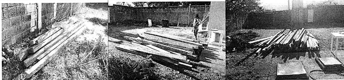
Madera en la Subestación de Policía de Tomarrazón

En total son: 70 piezas de la especie Perehuétano (Brosimun alicastrum) con medidas de 4m x 4" x 2" pulgadas, la incautación se registró en el acta 0235 de la policía nacional quienes hicieron la incautación del producto por no presentar permiso de la Autoridad Ambiental para su aprovechamiento y movilización, dejándola en su momento en la Subestación de Tomarrazón para el recibido legal por parte de la Autoridad Ambiental.