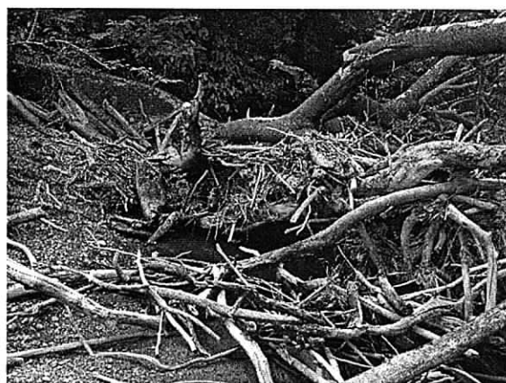
Fig. 5. Evidencia de obstrucción del cauce