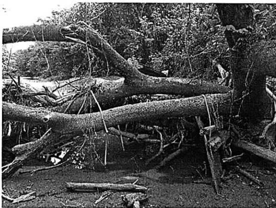
Fig. 2. Individuo arbóreo de orejero