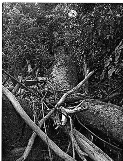
Fig. 4. Tamaño del individuo arbóreo cauce