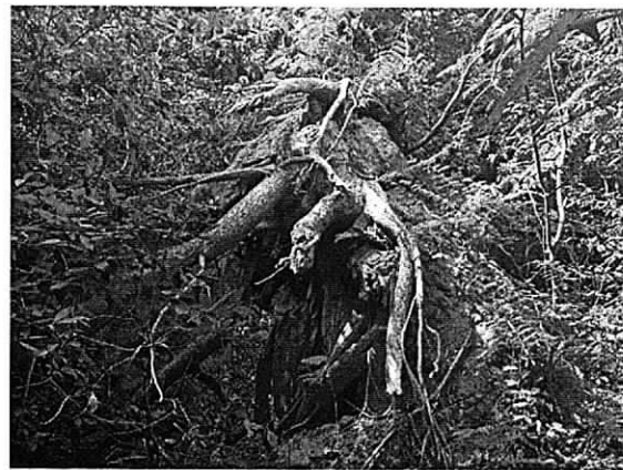
Fig. 3. Evidencia del volcamiento del individuo