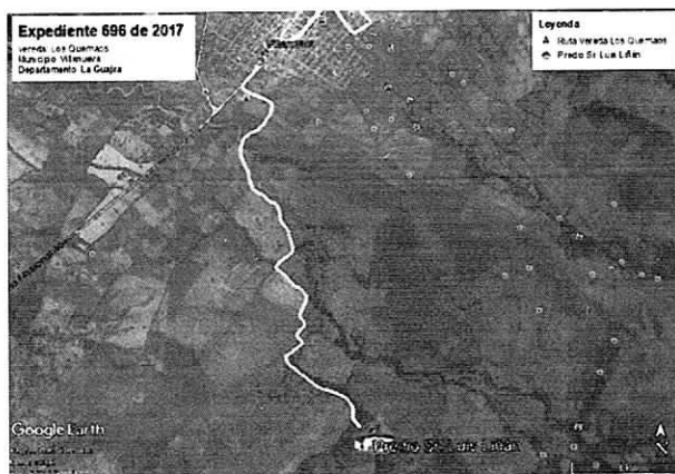
Fig. 1. Ubicación satelital del sitio de interés.

Se observa que se mantiene la franja de protección del río Los Quemaos, aunque no en un estado sucesional avanzado, por lo menos existe una cobertura vegetal arbórea que evita la evaporación del agua y regula el caudal del afluente.