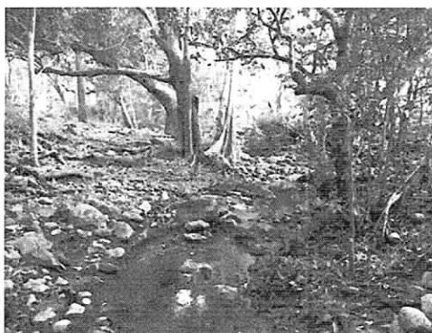
Fig. 5. Rio Los Quemados tramo predio Sr. Liñán