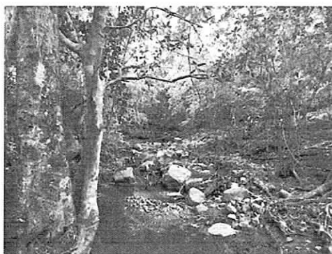
Fig. 6. Franja de protección rio Los Quemaos