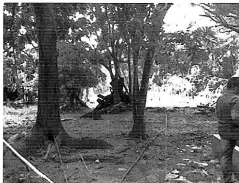
Fig. 3. Predio señor Luis Liñán