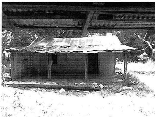
Fig. 2. Casa en abandono y solitaria