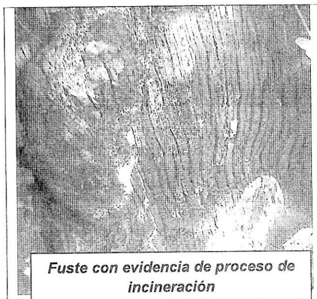
Fuste con evidencia de proceso de incineración