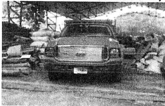
Fig. 1. Vehículo decomisado y usado en el transporte del Carbón Vegetal

Que en el acta única de control al tráfico ilegal de flora y fauna silvestre No 156506 se consignó toda la información relacionado con el decomiso y aprehensión.