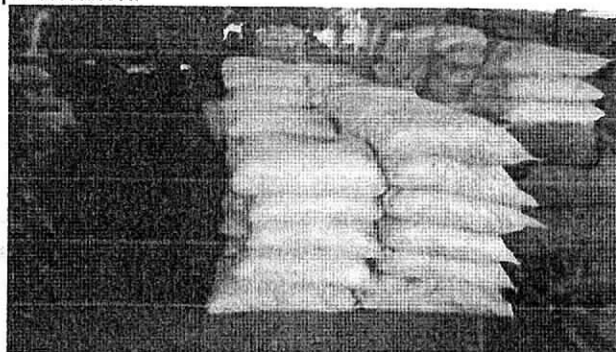
Fig. 2. 116 bulto de Carbón Vegetal especie Trupillo

Se realiza la incautación por no presentar ninguna documentación que acredite su legal transporte, como lo es el permiso o guía de movilización de productos forestales (Carbón vegetal).