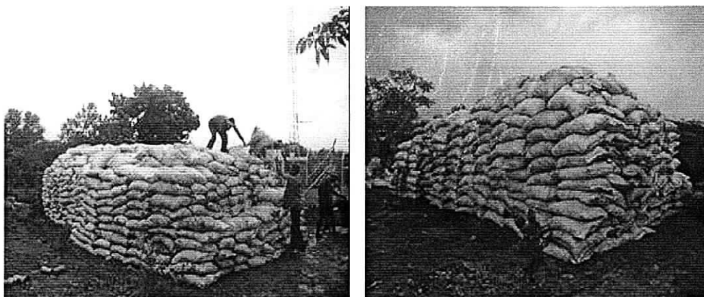
Producto acopiado en río claro

CONCLUSION: Según lo manifestado en el contexto del informe, el producto (Carbón vegetal), debe declararse en decomiso definitivo dado que la procedencia es del bosque natural en zona indígena y en el producto hay dos (2) especies declaradas en veda según Acuerdo 003 de 2012.