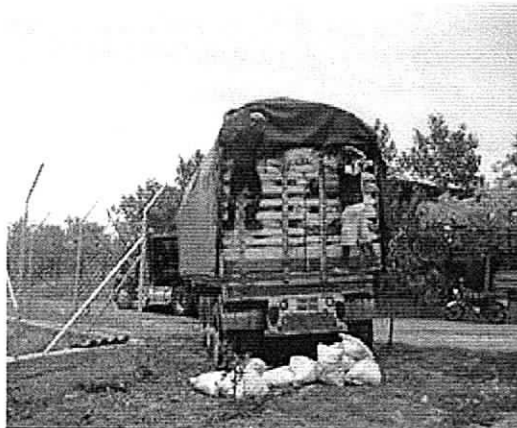
Vehículo en el predio Río Claro