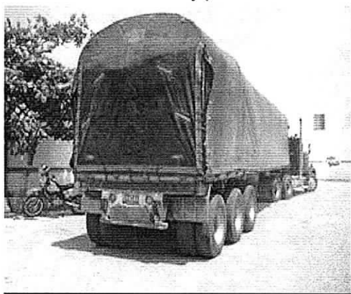
Vehículo en las instalaciones de la policía