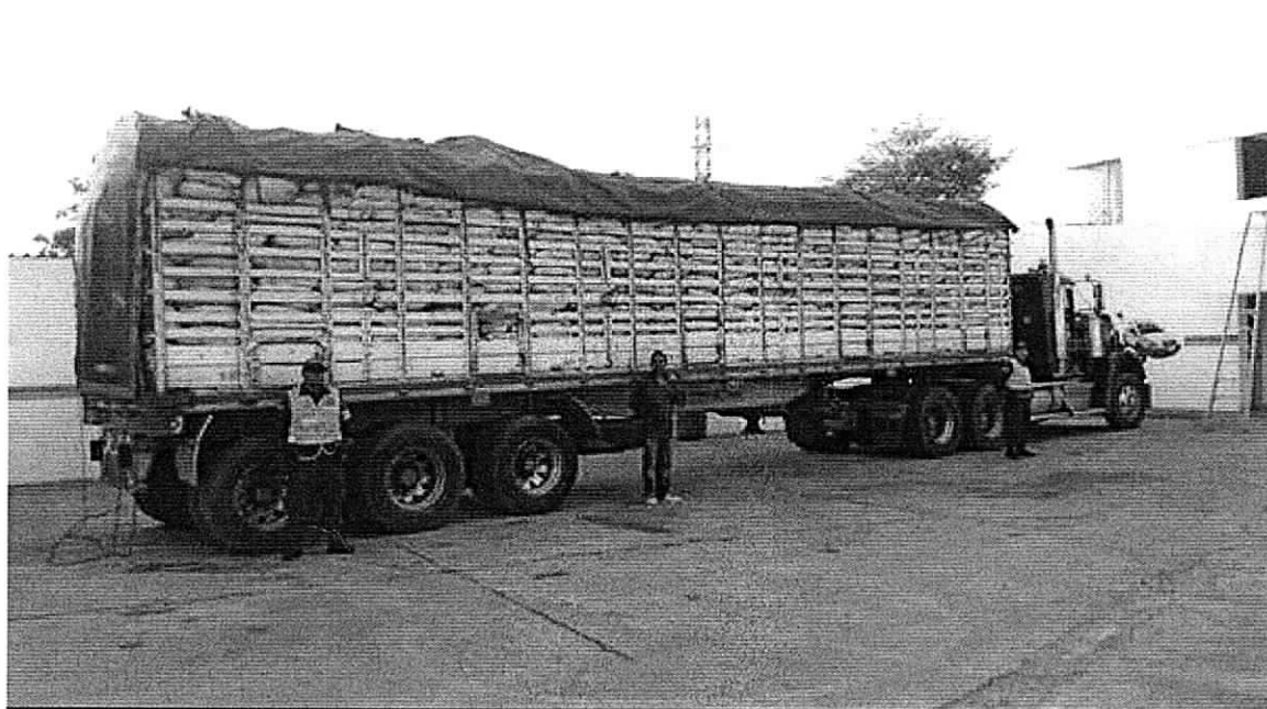
Tracto camión en las instalaciones de la Policía de carretera