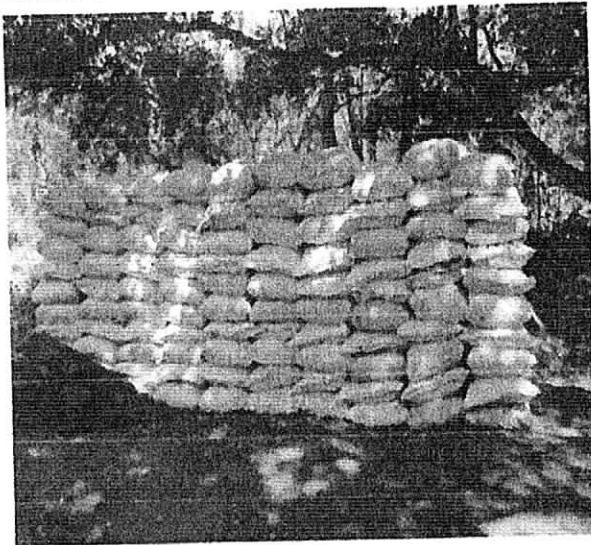
Imagen No 1