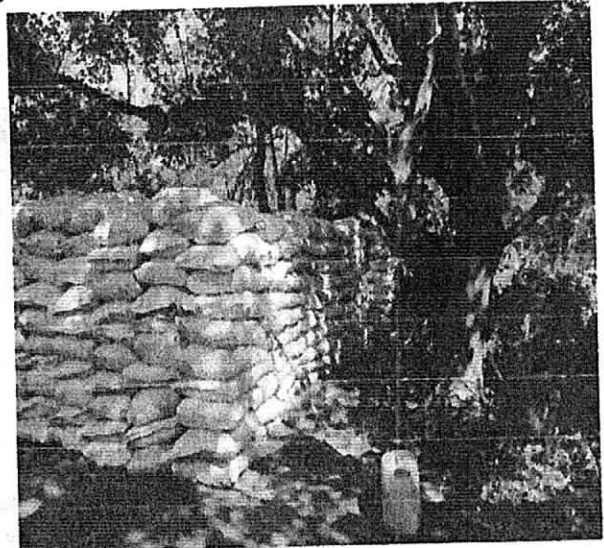
Imagen No 2