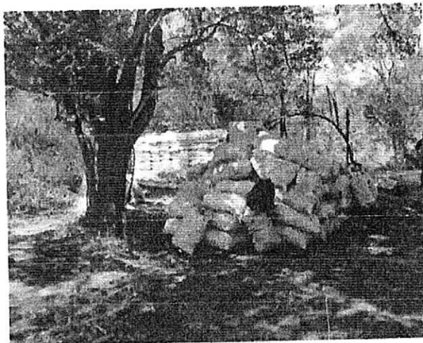
Imagen No 3