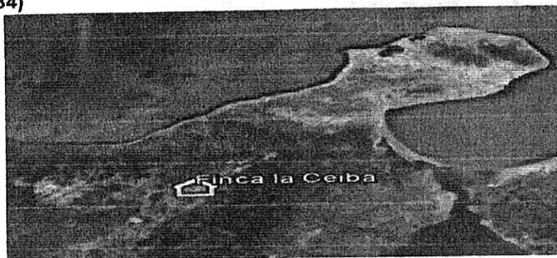
Imagen 1. Ubicación geográfica de los sitios visitados Imagen tomada de Google Earth – 2018

REFERENCIA (Lugar Coord. Geog. Ref. 72° 57'0.5" W 10° 41'18,1" N (Datum WGS84)