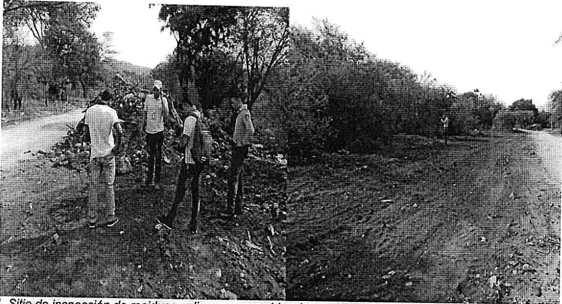
Fig. 1. Sitio de inspección de residuos peligrosos, se evidencia manipulación de la evidencia con apilamiento de residuos peligrosos con maquinaria pesada retroexcavadora.