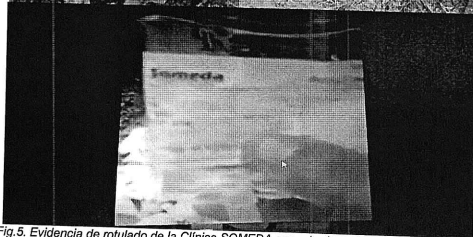
Fig.5. Evidencia de rotulado de la Clínica SOMEDA encontrado en los residuos peligrosos dispuesto de manera irregular barrio Bethel.