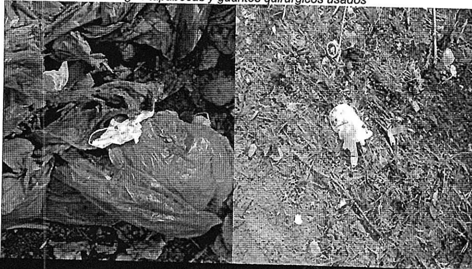
Fig. 4 tapabocas y guantes quirúrgicos usados