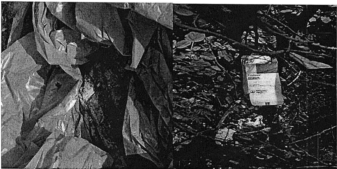
Fig. 3 gasas utilizadas en post- cirugía – recipiente de medicamento