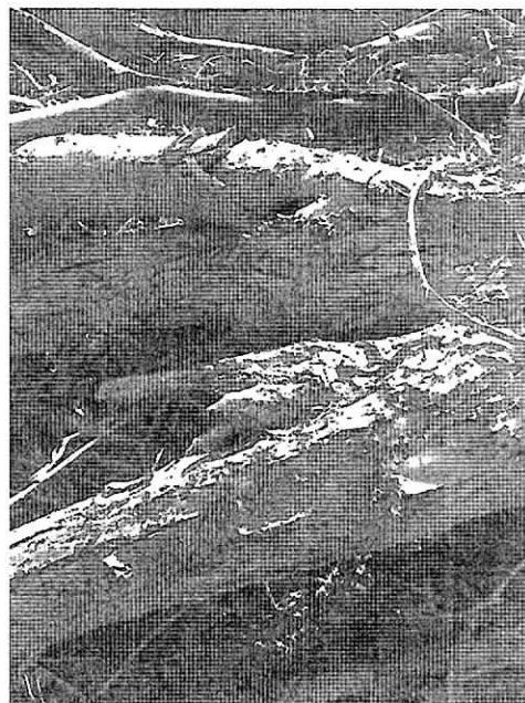
Fig. 3. Arrume de material vegetal