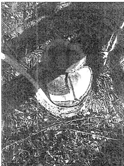
Fig 2. Medición de tocón Guayacán