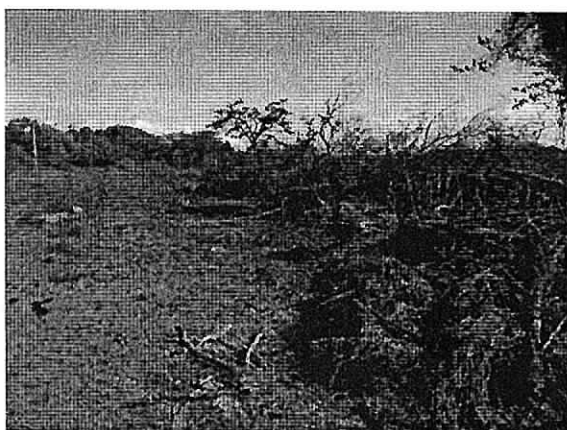
Fig. 4. Arrume de material vegetal