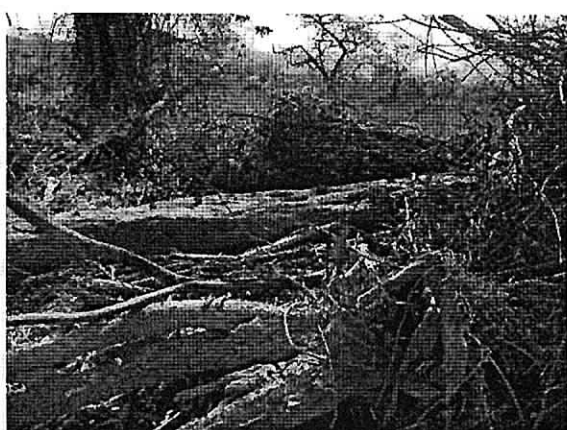
Fig. 5. Arrume de material vegetal