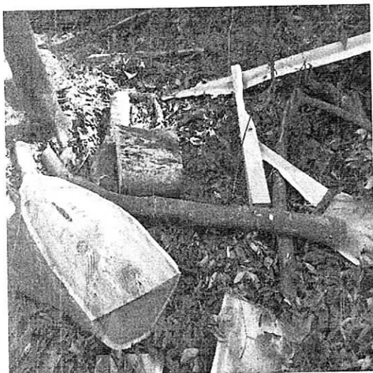
Fig. 3 Residuos de la actividad de aprovechamiento