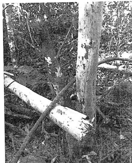
Fig. 4 Quiebre de individuos propios de la regeneración del bosque de galería.