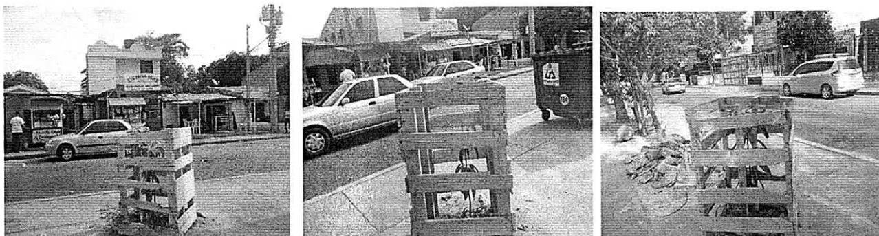
Fotos 1,2, 3, Evidencia de los tres (3) árboles que fueron sembrados en el boulevard de la calle 13 en compensación 8Junio 29/18)