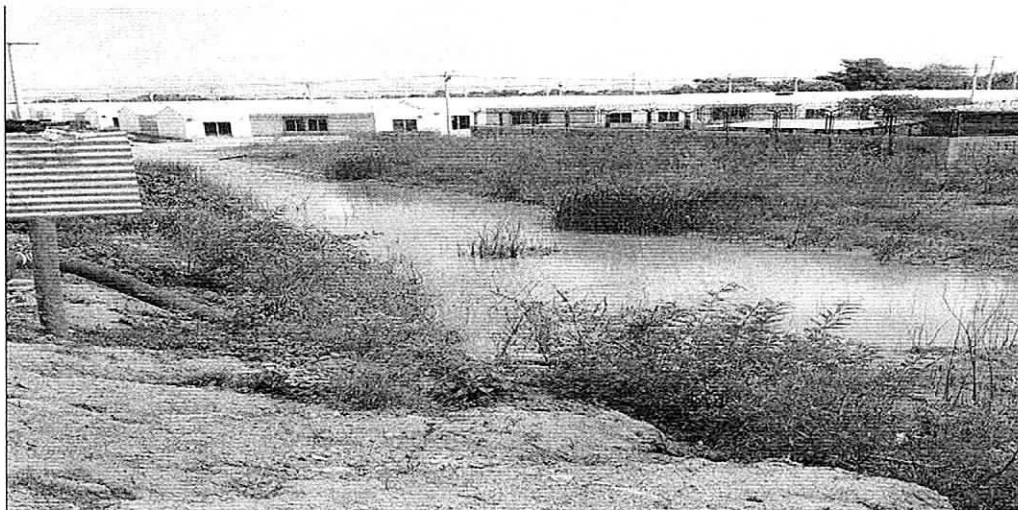
Fotografía 2. Registro de la urbanización Lomas del Trupillo.

En campo se logró observar que, en el límite de la zona urbana del Distrito de Riohacha, en la vía que conduce a la ciudad de Valledupar, sector izquierdo, se localiza la urbanización Lomas del Trupillo. Esta urbanización contiene 70 casas y locales asociados del sistema de interés social, las cuales fueron construidas aproximadamente hace tres (3) años. (Fotografía 2).