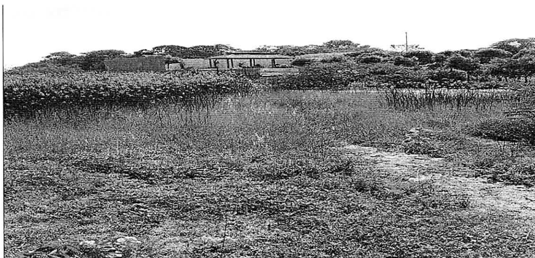
Fotografía 3. Zona donde se construirá la calle canal que evacuará aguas lluvias en la laguna El Patrón.

El proyecto en referencia consiste en construir una calle canal que inicia en la urbanización en referencia y termina en la laguna el patrón (Ver Fotografía 3), la distancia es de aproximadamente dos mil cien metros (2.100). El punto de entrega de aguas de la calle canal a la laguna, es la que genera la ocupación de cauce. La localización exacta del punto de ocupación se enmarca en las siguientes coordenadas: X 11°30'27.78" – Y 72°53'10.66".