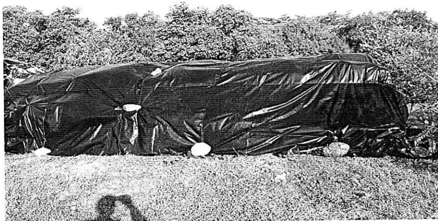
Carbón vegetal descargado en el predio río claro y cubierto con plástico para minimizar el deterioro

Evidencias del producto decomisado y almacenado en el (CAV).