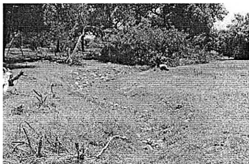
Fotografía 1 Depósitos aluviales

Por otro lado, el predio visitado se localiza sobre una formación de depósitos de llanura aluvial asociados a una unidad hidrogeológica A4, en terreno se evidencia la presencia de materiales de potencial explotación como se muestra en las siguientes fotografías.