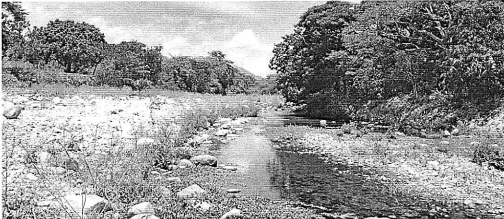
Fotografía 2 Márgenes erosionados

Visual coordenadas 11°10'51.67"N- 72°50'12.39"O