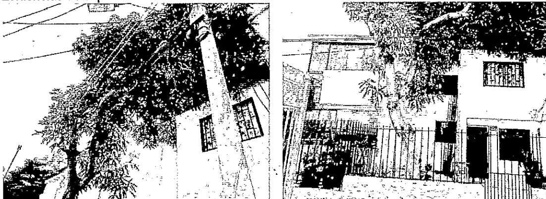
Tabla 1. Descripción de la especie.