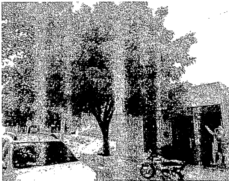
Ubicación y desarrollo del árbol de Neem en área del inmueble