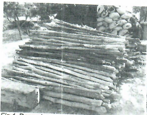
Fig. 1. Decomiso preventivo 198 Postes de diferentes especies

Se realiza la incautación por no presentar ninguna documentación que acredite su legal transporte, como lo es el permiso o guía de movilización de la madera.