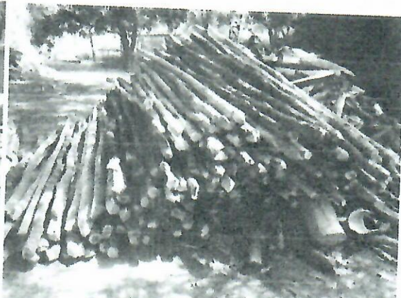
Fig. 2. Evidencia disposición en la Territorial Sur