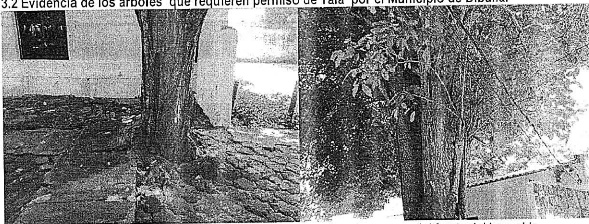
Arbol de Roble ( Tabebuia rosea ) ubicado en la parte externa area del frente del inmueble