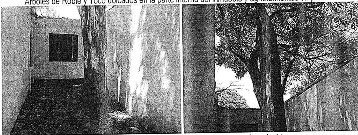
Árbol de Roble ubicado en la parte interna en espacio reducido