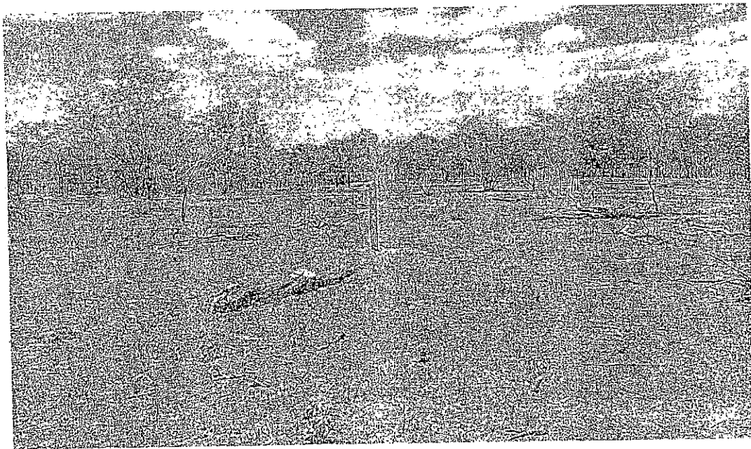
Fotografía 1. Sitio de la Perforación.