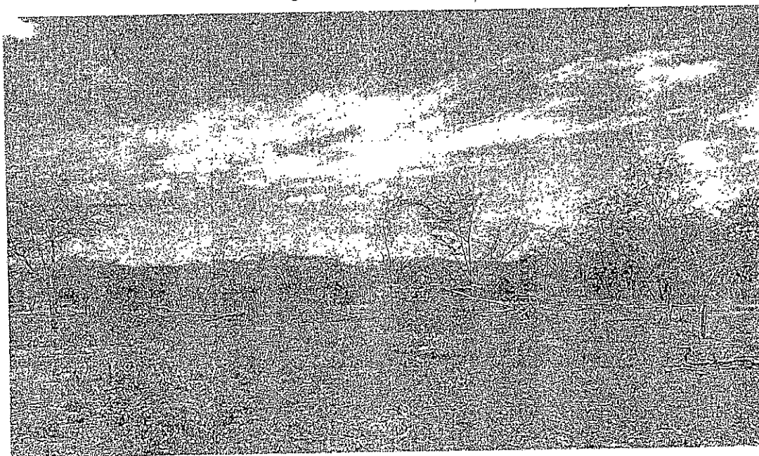
Fotografía 2. Cobertura vegetal

En los alrededores al punto donde se planea realizar el pozo no se localiza actividad cercana diferente a las actividades cotidianas de la comunidad, y la cobertura vegetal es escasa, de especies menores entre rastros, arbustos, cactus, y árboles de poco tamaño como trupillo. (Ver Fotografía 2).