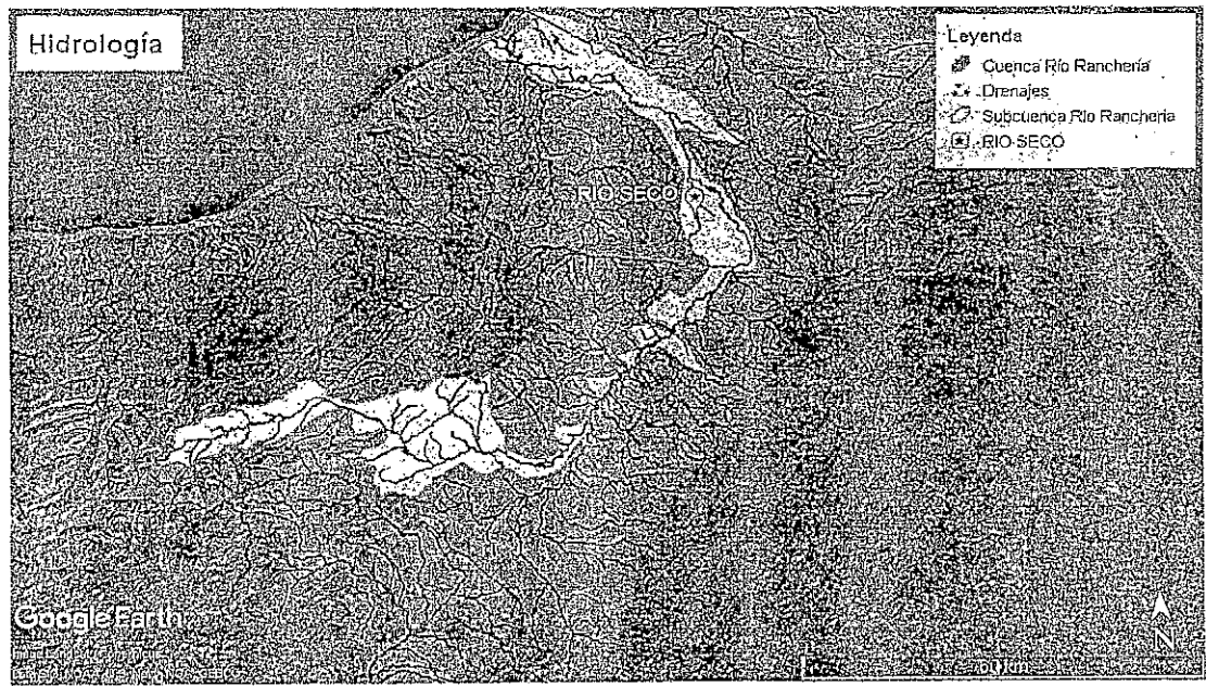
Figura 26. Hidrología de la zona

Dentro del predio de la Comunidad de Río Seco no se encuentra ningún tipo de drenaje permanente ni intermitente.