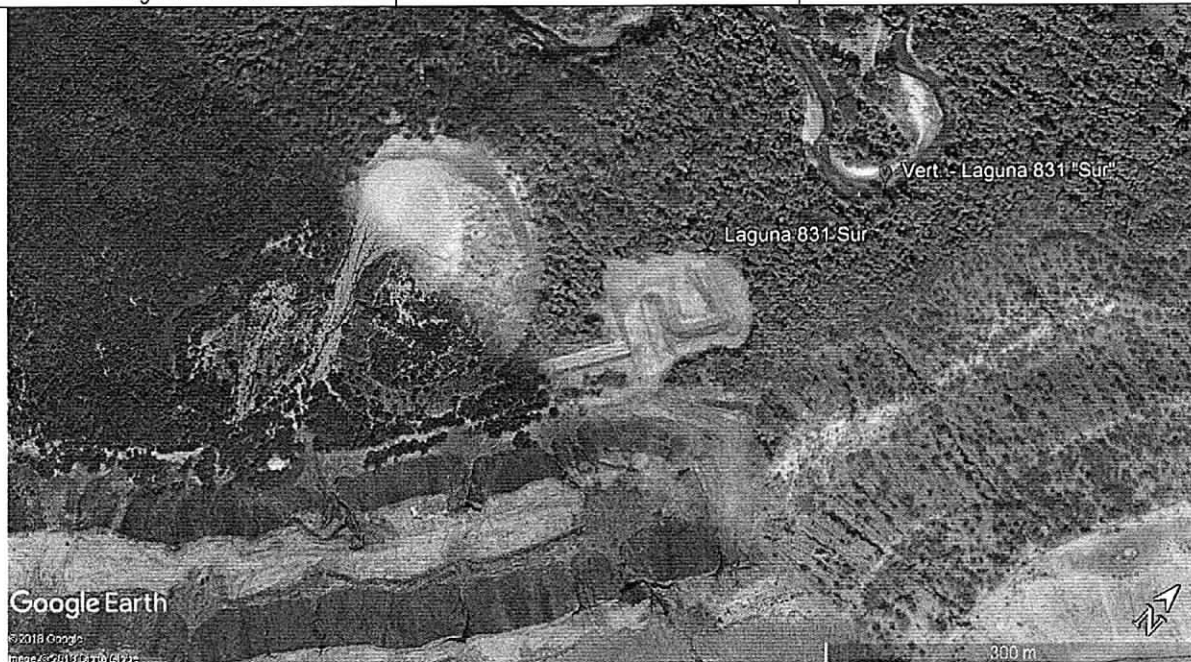
Imagen 2: Sitios Geo referenciados en campo, (Laguna 831 Sur) de la empresa Cerrejón.

Durante el recorrido se pudo evidenciar que la laguna 831 Sur no contenía ningún tipo de líquido (agua), y que por el contrario se encontraba totalmente seca lo qué concuerda con el suelo agrietado dentro del área de la laguna.