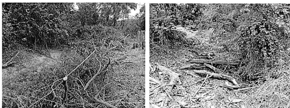
Fotos 4 y 5: Canal de conducción de la Laguna 831 Sur (seco, enmontado y con troncos en el centro del canal).

Se pudo observar que hay un canal hecho en tierra y sin revestimiento alguno, el cual se piensa utilizar para guiar el vertimiento que sale de la laguna 831 sur hasta el río Ranchería; este canal se encuentra enmontado y con árboles en su zona interna.