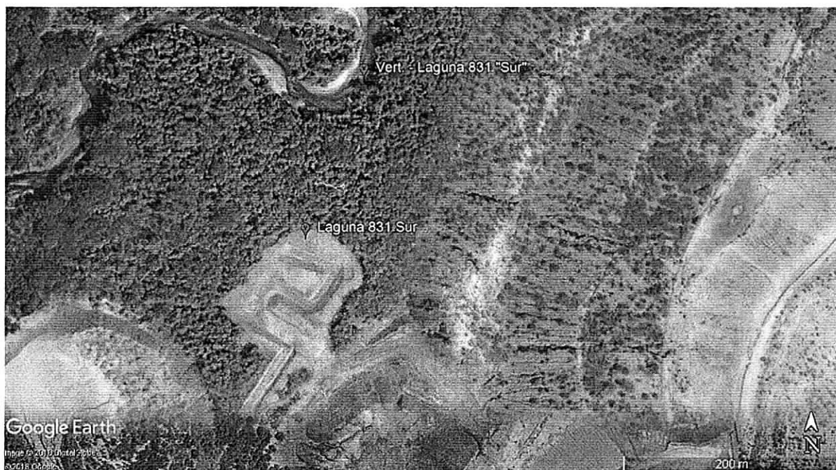
Imagen 1: Ubicación de la Laguna 831 Sur y del punto de vertimiento de la Lag. 831 Sur de la empresa Cerrejón.

Esta laguna está ubicada en las coordenadas N 11°00'53.893" W 72°43'46.867", recibe las aguas de la parte sur del botadero 831 y la parte norte del botadero Oreganal (área que se conoce como botadero Sarahita), estos dos botaderos están en proceso de rehabilitación, lo cual ayuda a disminuir la concentración de sulfatos y cloruros al momento en el que se vaya a realizar el vertimiento; Esta laguna tiene una configuración tipo pistón, además posee una capacidad de almacenamiento aproximadamente 15.000 m 3 . Actualmente no se está haciendo vertimiento por parte de esta laguna. En el momento en el que esta laguna realice el vertimiento este llegará al punto identificado con las coordenadas N 11°00'58.682" W 72°43'44.106" sobre el río Ranchería.