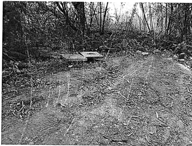
Fotos 3: Depresión ocasionada por el Vactor en el Tanque Séptico Oficinas

Según la información obtenida de la empresa, este tanque séptico hace su vertimiento directo al suelo, pero manifiestan el no tener los planos de construcción del mismo (ya que este tanque séptico estaba construido cuando la empresa Carbones del Cerrejón Limited – Cerrejón adquirió este predio), además en el día de la visita se pudo evidenciar que la estructura se encontraba totalmente llena con aguas residuales por lo que fue imposible en ese momento determinar como era su diseño. Se le recomendó a la empresa Cerrejón que realizara el mantenimiento correctivo de la parte externa del tanque séptico (arreglo de la tapa del tanque) y el mantenimiento preventivo en la parte interna del mismo (vaciado de aguas residuales, extracción de lodos y limpieza general) para que esta estructura tenga un buen funcionamiento. En el momento en el que la empresa Cerrejón este realizando estas labores podrán llevar a una persona idónea para que realice el diseño de dicha estructura y así tener una información veraz de cómo es su funcionamiento.