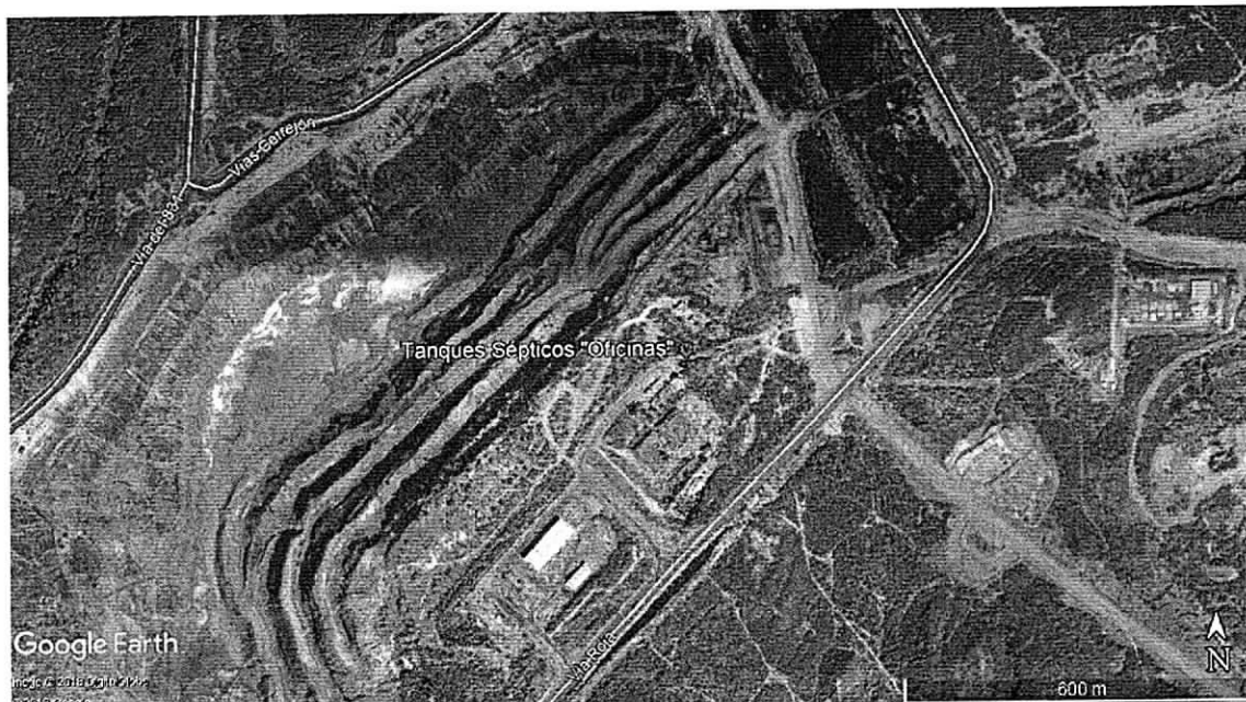
Imagen 1: Ubicación del Tanque Séptico Oficina (Gecolsa) de la empresa Cerrejón.

La estructura del sistema de tratamiento de aguas residuales de la empresa Carbones del Cerrejón Limited – Cerrejón (Tanque Séptico Oficinas) recoge las aguas residuales de sanitarios y lavado del área de oficinas (antiguo GECOLSA). Está ubicado en las coordenadas N 11°01'38.30" W 72°42'14.61" . Debido al bajo flujo de personal el caudal del efluente es bajo, de tal forma que se evapora y se infiltra y no presenta vertimiento a ningún cuerpo de agua. Actualmente el agua que llega a este tanque séptico esta siendo succionada por un Vactor y la están disponiendo en las lagunas de estabilización de la empresa.