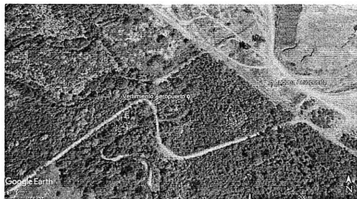
Imagen 1: Ubicación satelital de la Laguna Aeropuerto y del punto de vertimiento de la Lag. Aeropuerto de la empresa Cerrejón.

la mitad del caudal solido en suspensión que lleva los ríos más caudalosos de Colombia de acuerdo con la literatura consultada.