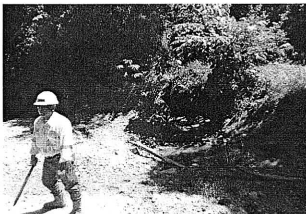
Foto 6: Corriente natural del arroyo Palomino cerca al punto de vertimiento de la Laguna Palmarito.

Luego de terminar la visita en campo dentro de la empresa Cerrejón se realizó una reunión de cierre donde se conversó sobre los temas (puntos de vertimientos) observados durante los días de la visita. Se realizaron observaciones sobre no realizar vertimientos en los puntos visitados hasta no haber terminado todos los trabajos referentes a las Lagunas, canales y su impermeabilización y las demás labores de adecuación pertinentes para el debido cumplimiento ambiental legal.