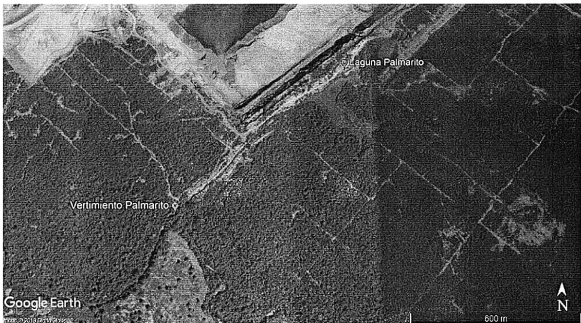
Imagen 1: Ubicación satelital de la Laguna Palmarito y del punto de vertimiento de la Lag. Palmarito de la empresa Cerrejón.

Durante el recorrido realizado en campo se llegaron a varios puntos entre los cuales tenemos: