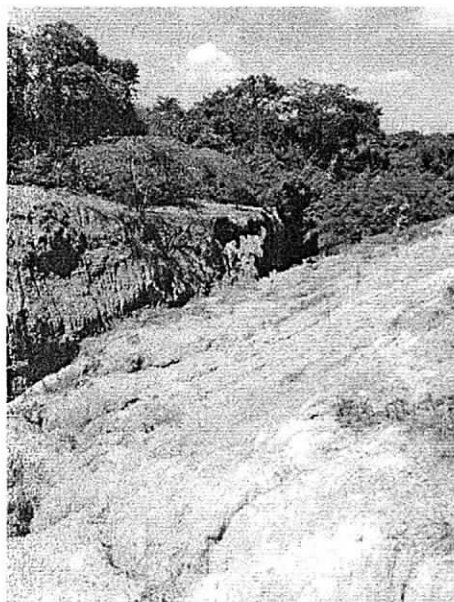
Fotos 4 y 5: Canal natural que posiblemente se utilice para guiar las aguas de vertimiento de la Laguna Palmarito - Cerrejón

En el punto de entrada del canal al arroyo Palomino (punto de vertimiento identificado en campo) no se observó que se estuviese vertiendo algún tipo de agua; el agua que se observó en el sitio corresponde a la corriente natural del arroyo.