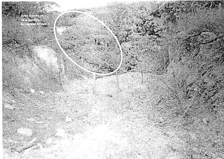
Foto 1: Área donde piensa construirse la Laguna Annex II - Cerrejón

Durante el recorrido también se pudo observar que en el área donde va a quedar ubicada la laguna Annex II, aun no se han iniciado las obras civiles de construcción de dicha estructura, no hay presencia de agua en el terreno y el área donde se piensa construir la laguna se encuentra con una cobertura boscosa, por lo cual debe solicitar el debido permiso de aprovechamiento forestal y se debe tener en cuenta por parte de la empresa lo relacionado con el acuerdo N° 003 de 2012 (especies vedadas).