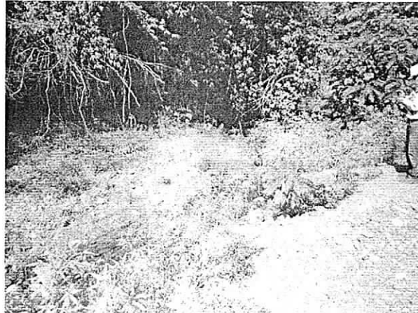
Fotos 3: Presencia de agua en el canal natural donde se realizará el Vertimiento de la Laguna Annex II - Cerrejón

Durante el recorrido se observó que existe un canal de escorrentía superficial natural el cual comunica a la zona donde se va a construir la Laguna Annex II con el sitio donde se presume que se realizará el vertimiento. En parte del trayecto del canal se logró observar la presencia de agua, pero esta no procedía del botadero Annex sino de uno de los brazos del arroyo Cerrejón.