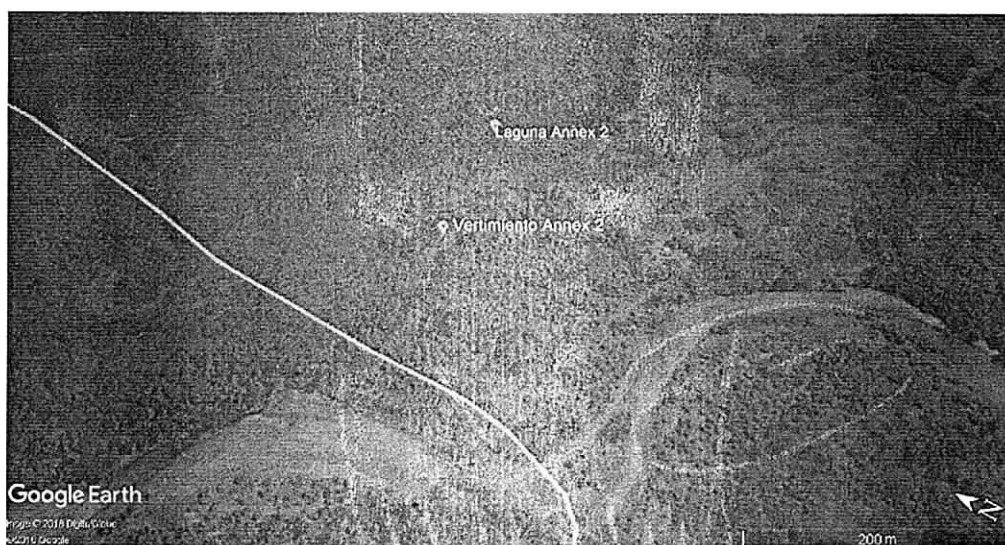
Imagen 1 y 2: Presunta - Ubicación satelital de la Laguna de Sedimentación del Botadero Annex II y del punto de vertimiento de la Laguna de Sedimentación del Botadero Annex II de la empresa Cerrejón.

Durante el recorrido realizado en campo se llegaron a varios puntos entre los cuales tenemos: