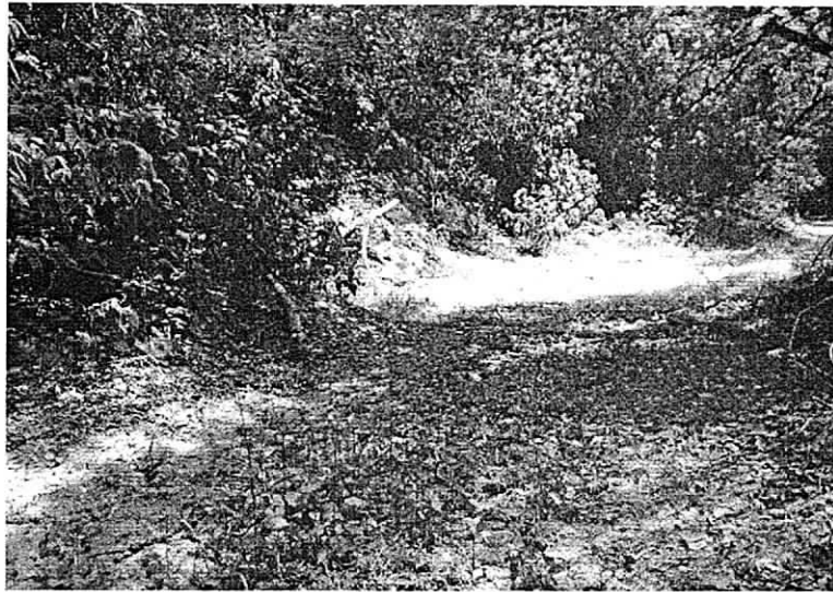
Foto 4: Presencia de humedad en el cauce natural del arroyo Bruno.

Luego de terminar la visita en campo dentro de la empresa Cerrejón se realizó una reunión de cierre donde se conversó sobre los temas (puntos de vertimientos) observados durante los días de la visita. Se realizaron observaciones sobre no realizar vertimientos en los puntos visitados hasta no haber terminado todos los trabajos referentes a las Lagunas, canales y su impermeabilización y las demás labores de adecuación pertinentes para el debido cumplimiento ambiental legal.