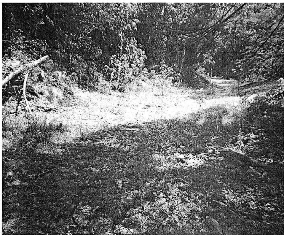
Fotos 3: Punto de Vertimiento de la Laguna La Esperanza - Cerrejón

Luego de visitar la zona donde va a ser construida la Laguna La Esperanza el personal de la visita se dirigió al sitio donde presuntamente va a estar ubicado el punto de vertimiento (sitio identificado en campo) hacia donde serán dirigidas las aguas de dicha laguna (este sitio visitado en campo corresponde a las coordenadas aportadas por la empresa Carbones del Cerrejón Limited – Cerrejón en el F.U.N.).