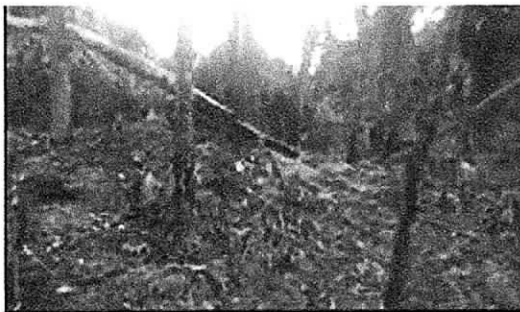
Detalle de la zona PC4, con evidencia de quema-tala y presencia de 10 árboles quemados Spondias mombin , Anacardium excelsum y Mangifera indica .