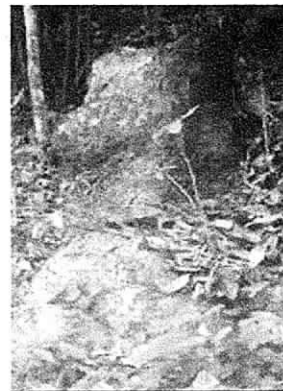
Detalle de tocón PC3, de 1,10 m de diámetro basal, correspondiente a la especie Anacardium excelsum , talado a orilla del río Naranjal