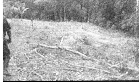
Detalle de la zona PC5, que presenta tala frente al río Naranjal