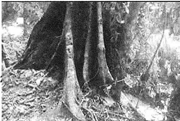
Detalle del punto PC2, área basal quemada de un árbol de la especie Caracoli ( Anacardium excelsum ), con fines de tala