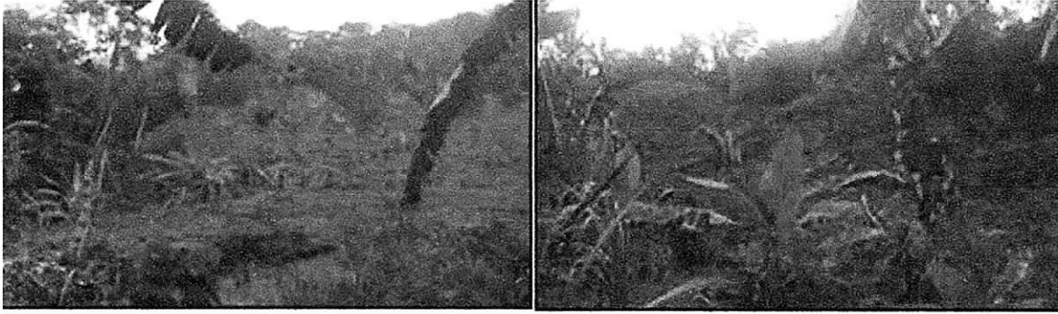
Detalle del predio PC7, con evidencia de quema y tala de 50 árboles y especie menores.