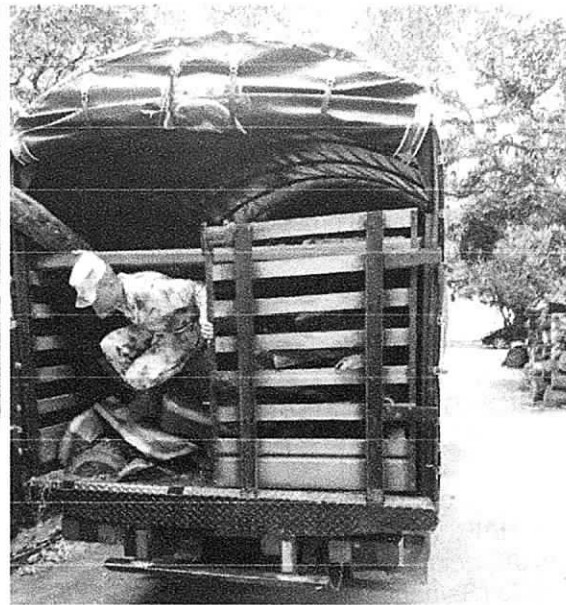
Fig. 1. Recepción de madera (orillos) Fig. 2. Puesto a disposición del decomiso