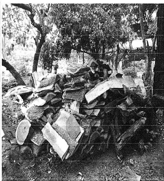
Fig. 3. Descargue de la materia prima Fig. 4. Total del Decomiso preventivo