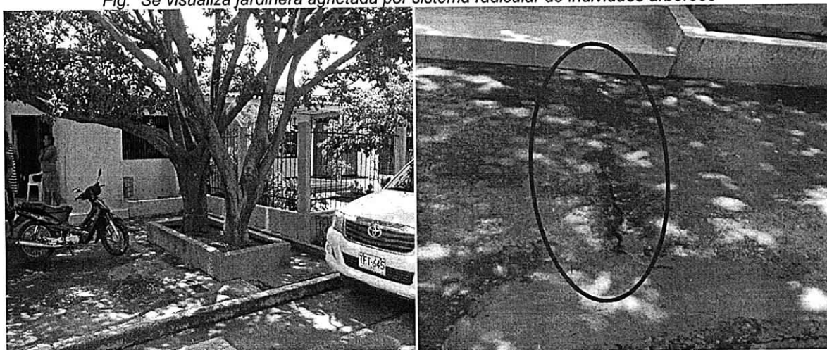
Fig. Se evidencia agrietamiento de piso por sistema radicular de individuos arbóreos.