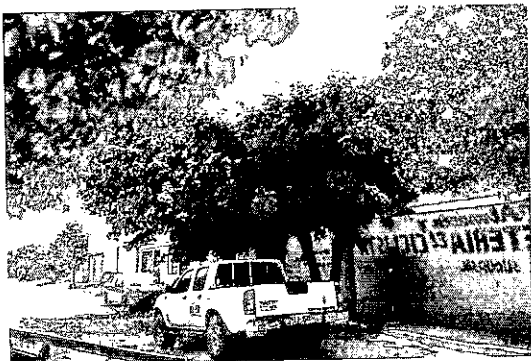
ARBOL DE NEEM