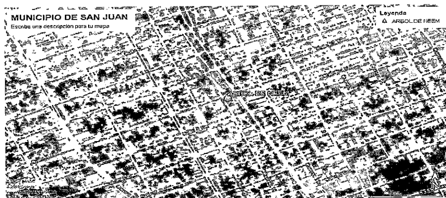
Fig. 1. Ubicación satelital del individuo arbóreo de la especie Neem.