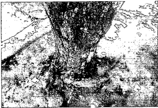
SISTEMA RADICULAR DEL INDIVIDUO ARBOREO