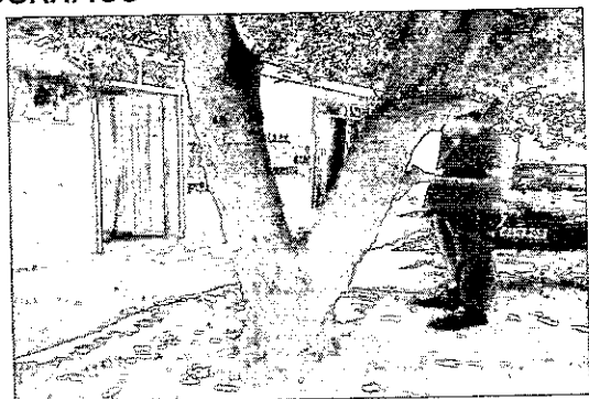
BIFURCACION DEL ARBOL