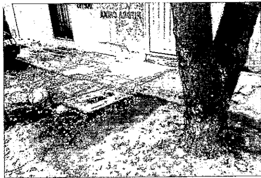
FUSTE DEL INDIVIDUO ARBOREO