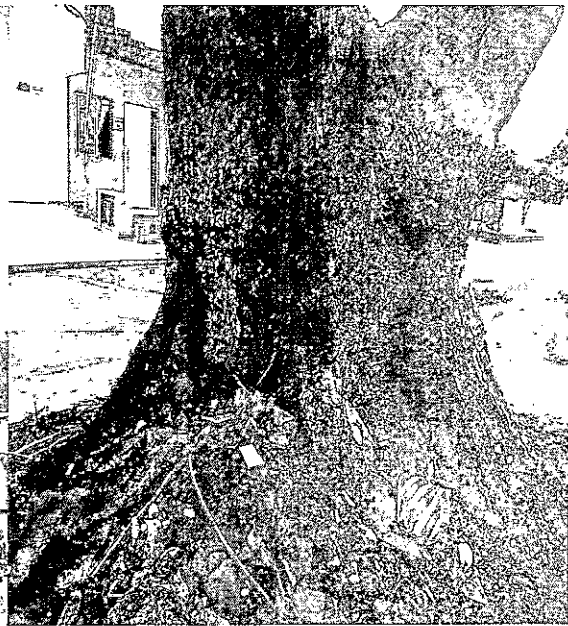
Fig. 6. Descomposición base de fuste