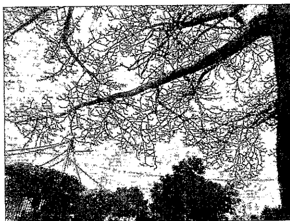
Fig. 3. Evidencia rama seca