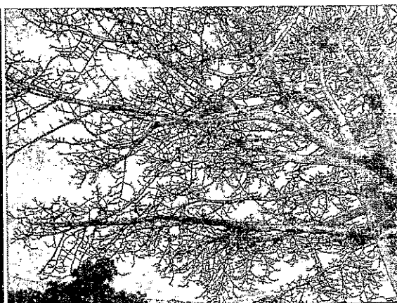
Fig. 4. Evidencia yemas terminales secas