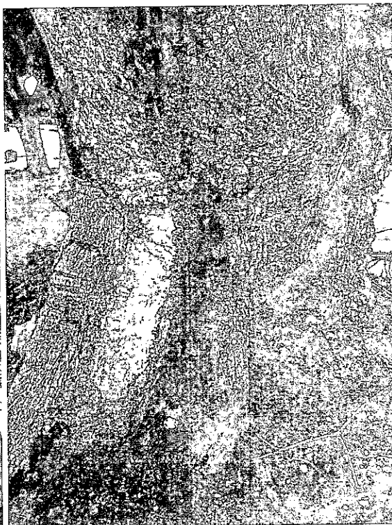
Fig. 4. Evidencia yemas terminales secas