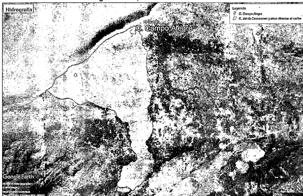
Figura 2 Cuerpos lóticos de la zona

El punto de perforación se localiza sobre la cuenca del río Camarones, (ver Figura 2). Como se observa en la figura, en la zona de interés no se avistó ningún cuerpo lótico de tipo permanente o intermitente.