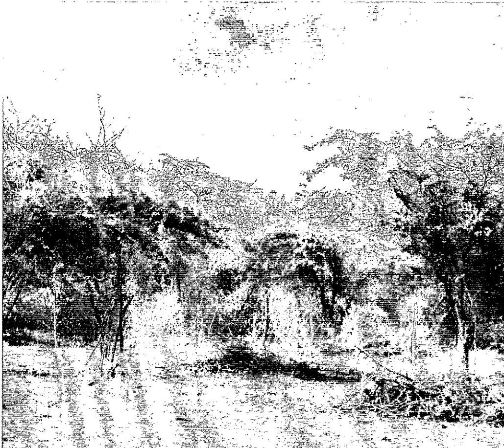
Fotografía 2 Cobertura vegetal: especies menores