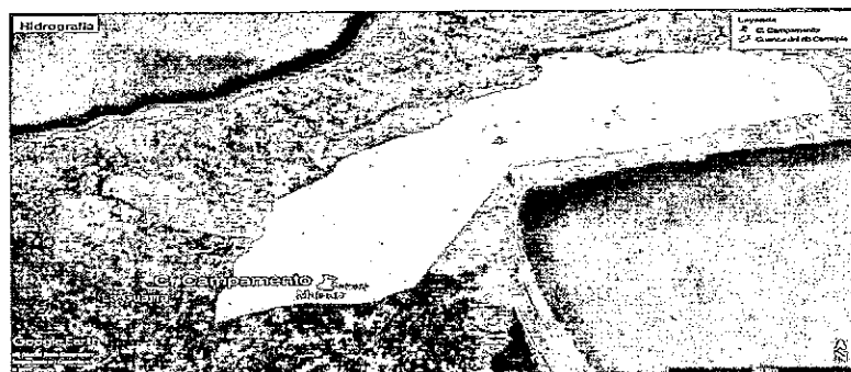
Figura 2 Cuerpos lóticos de la zona

Figura 2). Como se observa en la figura, en la zona de interés no se avistó ningún cuerpo lótico de tipo permanente o intermitente.