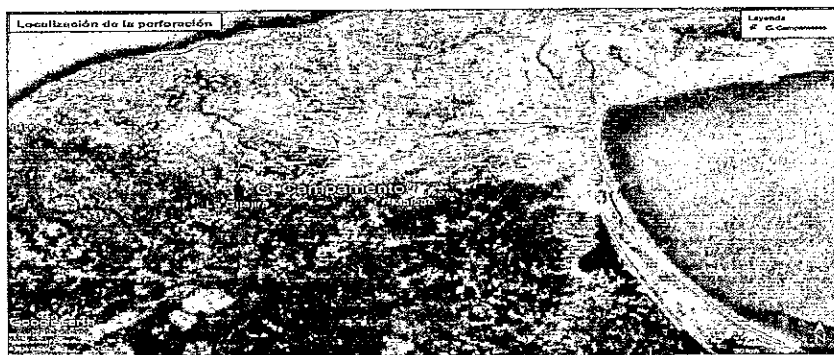
Figura 1 Localización de la perforación proyectada