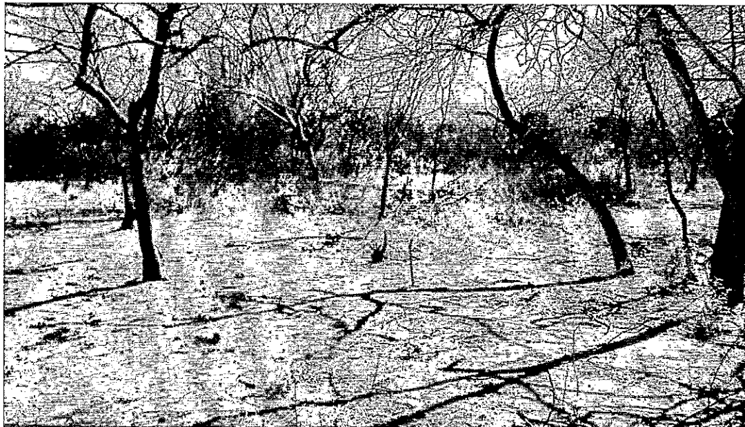
Fotografía 1. Sitio de la Perforación.