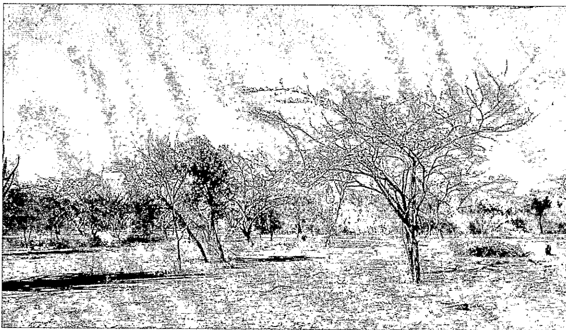
Fotografía 2. Cobertura vegetal

En los alrededores al punto donde se planea realizar el pozo, no se localiza actividad cercana diferente a las actividades cotidianas de la comunidad, y la cobertura vegetal es escasa, de especies menores entre rastrojos, arbustos, cactus, y árboles de poco tamaño como trupillo. (Ver Fotografía 2).