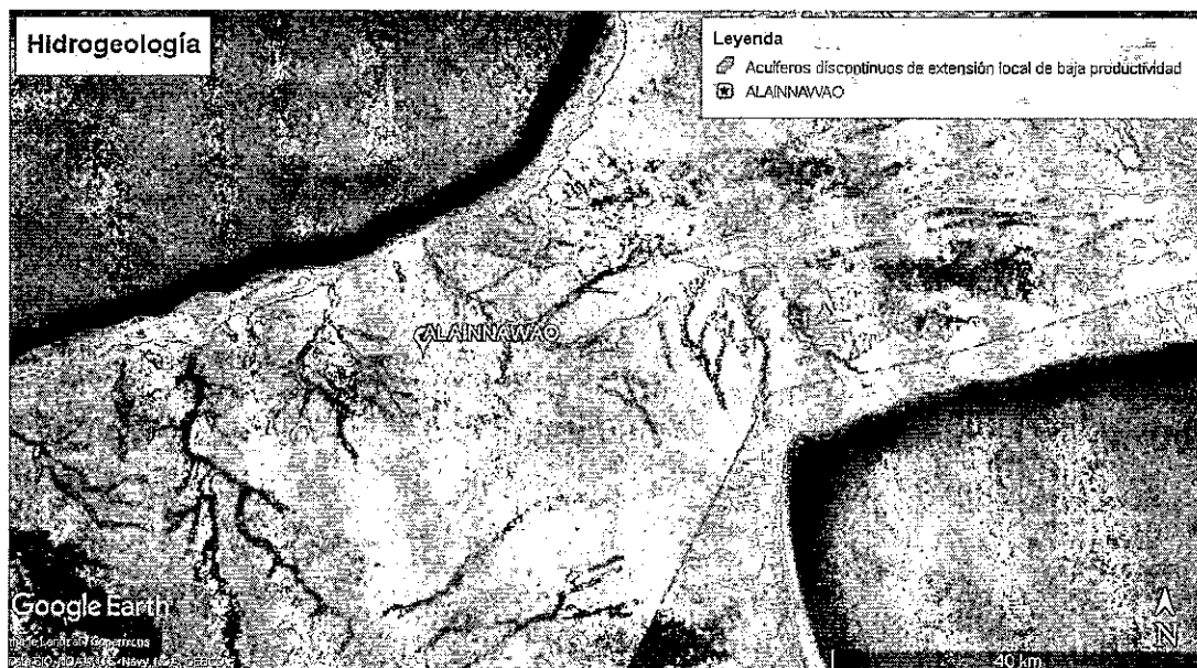
Figura 3. Hidrogeología