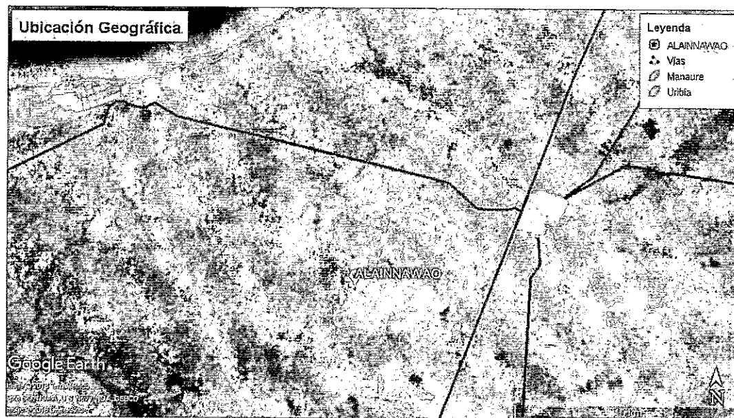
Figura 1. Localización de la perforación proyectada

El area objeto de la solicitud se localiza en la comunidad indígena de ALAINANAWOU, la misma está situada en cercanías al municipio de Uribí, para llegar hasta allí se recomienda partiendo desde la cabecera municipal de Uribí en el cruce de "4 vías", por vía terrestre, tomar hacia el Occidente la carretera asfaltada, luego de 2 km, en la intersección, se desvía hacia la izquierda tomando la carretera que se encuentra sin pavimentar, luego de 2.8 km se debe cruzar a la izquierda nuevamente hacia el suroccidente, 4.31 km siguiendo la misma vía, se encuentra un desvío hacia la derecha, a 60 m se encuentra la comunidad indígena de ALAINANAWOU. El punto donde se proyecta realizar la perforación se localiza en las coordenadas mostradas en la Tabla 1 y en el punto indicado en la Figura 1.