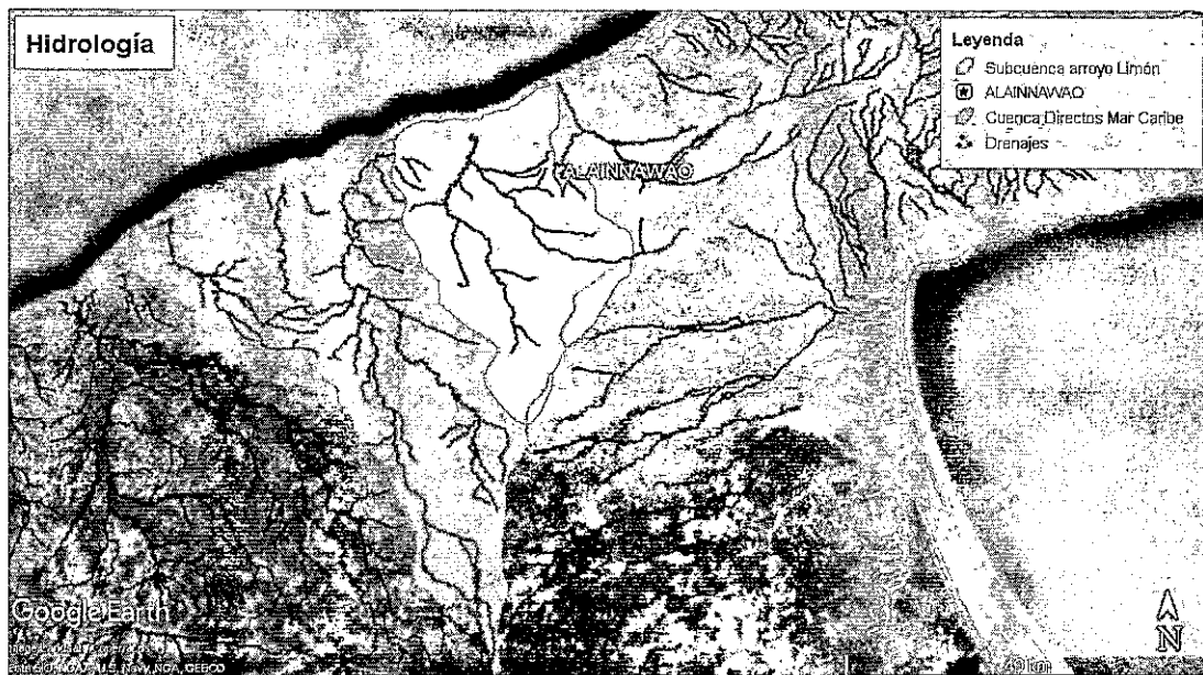
Figura 2. Hidrología de la zona

El punto de perforación se localiza sobre la Cuenca Directos al Mar Caribe, en la subcuenca del Arroyo Limón (ver figura 2). Relativamente cerca al punto de captación proyectado no se encuentran fuentes hídricas superficiales.