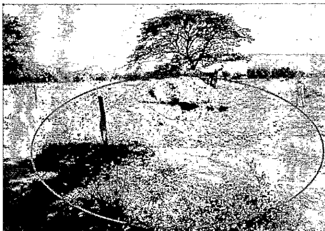
Fig. 1 se evidencia operación extractiva material arenoso