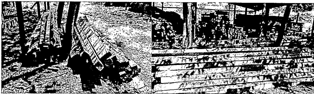
Las fotos corresponden a la madera ubicada en el predio río claro