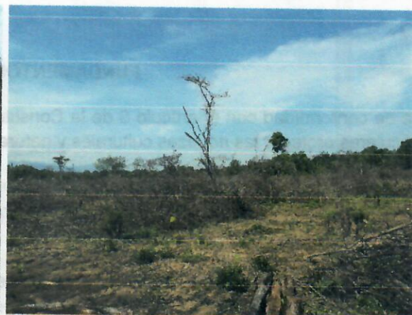
Fig.6. Evidencia de trabajo de Rocería