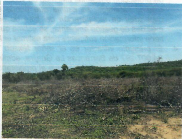
Fig.4. Evidencia de remoción cobertura vegetal