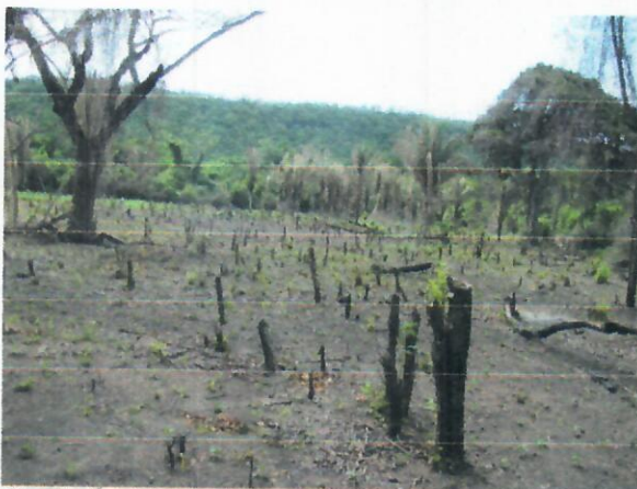
Fig.5. Acción de Rocería