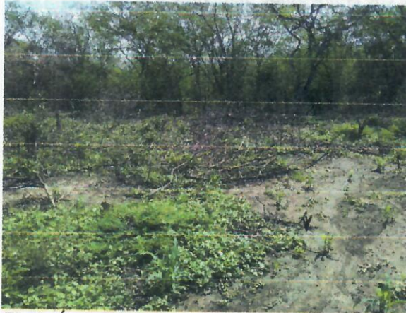
Fig.3. Área Socolada